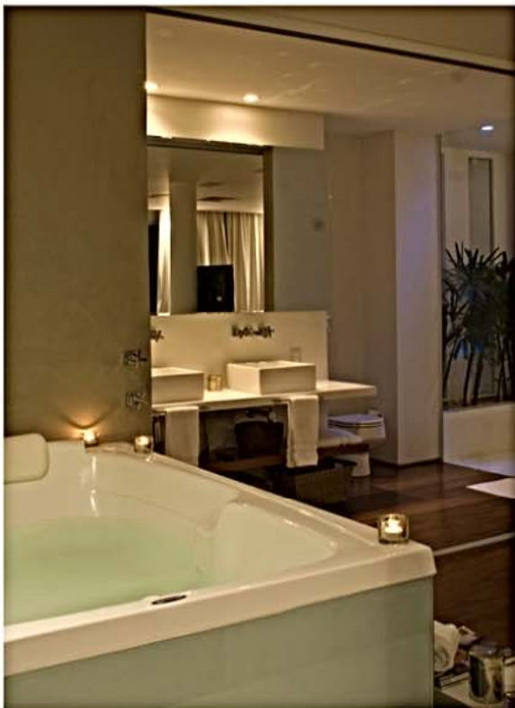
No conceito lofi, a hidromassagem e banheira se integram à suite master. Ao lado, a cozinha apresenta linguagem atual nos revestimentos e acessórios